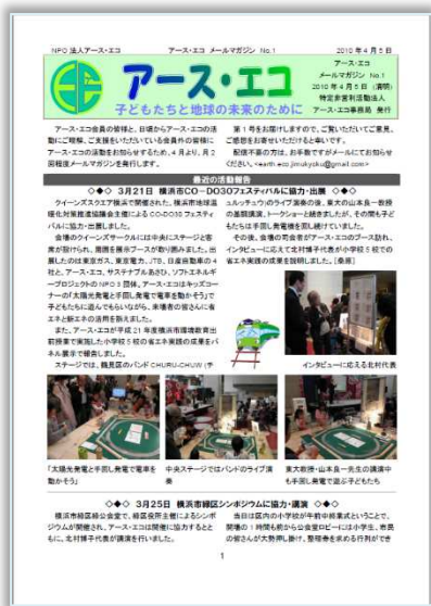
第 1 号の紙面