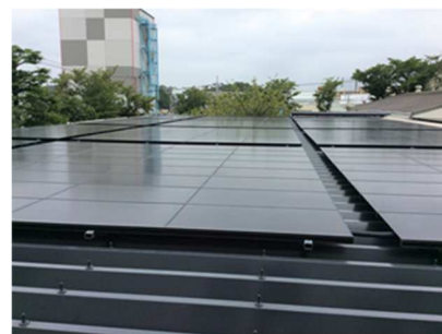
社屋の屋根には太陽光発電が