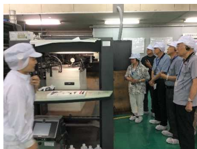
印刷ラインの見学