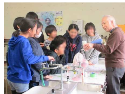
実験を通して省エネについて学ぶ