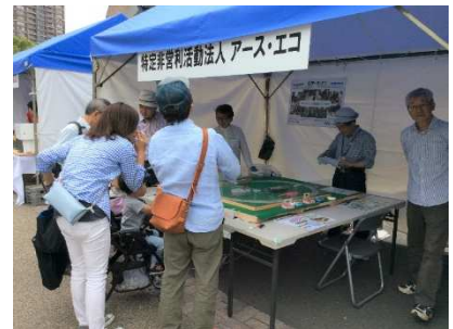
昨年の出展の様子

アース・エコは26日(日)のみ出展します。横浜公園の市庁舎前の入口近くの47番ブースで皆さんのご来場をお待ちしています。