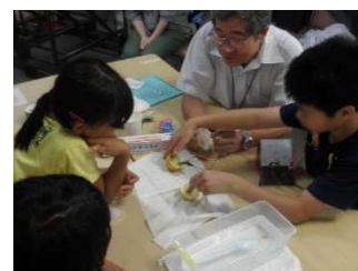
レモン電池を作ってみる