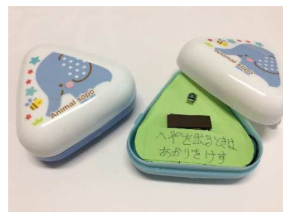
今回がデビューとなった おむすび型ソーラーオルゴール