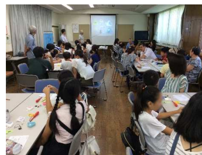
会場に集まった参加者の 皆さんと講師・スタッフ