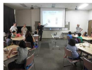
電池についてのお話し

もちろん「エコ講座」なので、いつも通り地球温暖化の話や、省エネ実験体験、ゲームなどのメニューも含む盛りだくさんの講座で、2時間30分と少し長めでしたが、参加した子どもたちは最後まで集中して学んでいました。 [桑原]