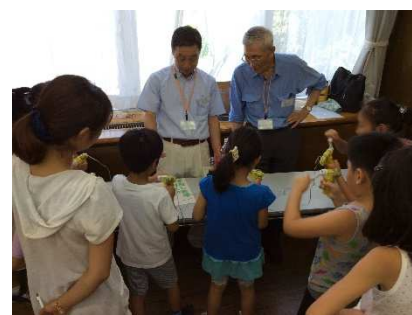
手回し発電機で発電体験 説明するスタッフ、左が筆者

今回の講座は、白山地区センターの夏休みわんぱく講座での開催要請から実施した訳ですが、結果として定員を超える受講者の参加を得られ、大変興味深い講座として受け止められたことは良かったです。①温暖化説明と、②ソーラーオルゴール工作という組み合わせは、小学低学年にとってはやや難しい内容でしたが、特に低学年(1, 2, 3年生)は保護者に付き添って頂い