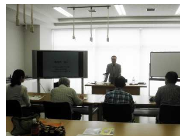
講演に耳を傾ける受講生の皆さん

受講生の皆さんはメモを取りながら大変熱心に耳を傾けてくれました。これからの活動の参考になるお話ができていれば幸いです。 [桑原]