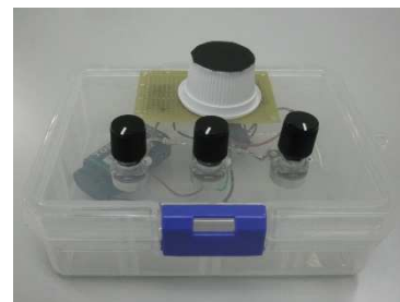
光の三原色の実験装置