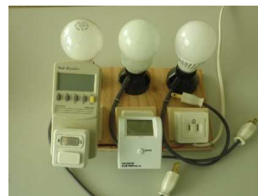
照明消費電力比較の実験装置

気象庁から公表された「気候変動監視レポート 2015」について、内容を抜粋して紹介しました。