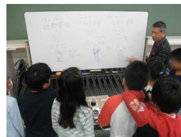
電球の種類の違いについて ホワイトボードを使って説明