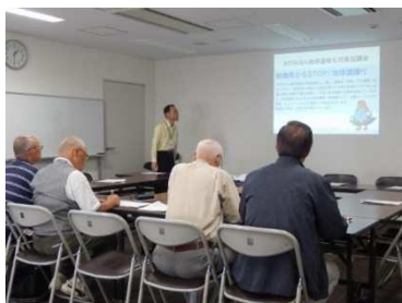
自治会長会議で講師を務める

今年度、さがみはら地球温暖化対策協議会(温対協)では、自治会を通じて市民の皆さんに地球温暖化の現状と日常生活の中での温暖化対策についてお話しする出前講座を無料で開催しています。アース・エコは温対協に協力して、毎回講座の講師を務めています。