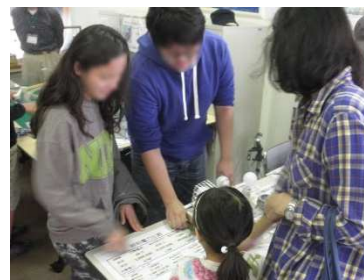
[桑原] 来場者に省エネを説明する大学生