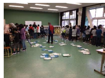
4 グループに分かれて 省エネ実験を体験