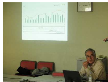
1時間単位の消費電力データを 紹介する会員