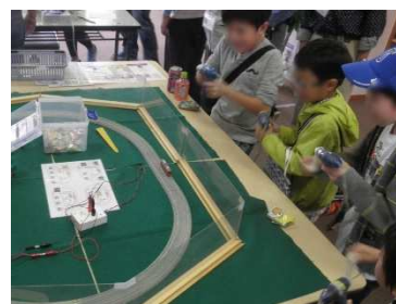
「電車の競走」で遊ぶ子どもたち

今回は桜美林大学の大学生2名が見学に来ました。市民活動に関心を持ち、自分自身で活動を立ち上げることを目指しており、出展の様子を見て参考にしたいとのことでした。省エネ実験などの説明を一通り聞いた後、自分でも説明員になって来場者に説明してくれましたが、さすがに理解の速さ、正確さと堂々とした態度での説明は立派でした。