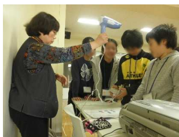
ドライヤー消費電力測定