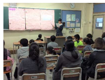
地球温暖化について発表

11 月 19 日(土)の学習発表会では、保護者の皆さんと一緒に 5 年生 3 クラスの発表「守ろう、みんなの地球～未来の環境問題を考えよう」を聞かせていただきました。温暖化に限らず、異常気象、水質汚濁、大気汚染、森林減少、砂漠化、資源循環、オゾン層破壊など様々な地球規模の問題を取り上げ、調べた成果を発表しました。明らかにインターネットで調べた内容をほとんどそのまま発表している物もありましたが、色々工夫してポスターにまとめて一所懸命発表している姿からは、「これも一つの成功体験で、これから少しずつ理解を深めていけば良いのかな。」と思いました。 [桑原]