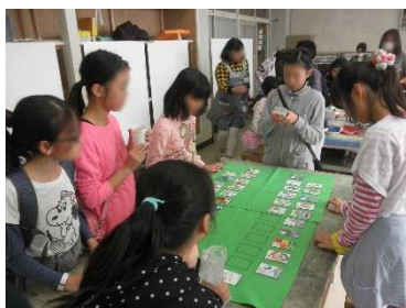
詠み手と二人の取り手に分かれて エコかるた取りを楽しむグループ

11月12日(土) 横浜市緑区の長津田第二小学校で PTA 主催の「すぎの子まつり」が開催されました。アース・エコは今年もブース出展しました。