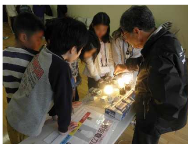
照明消費電力測定