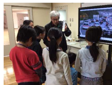
テレビ画面輝度と消費電力測定