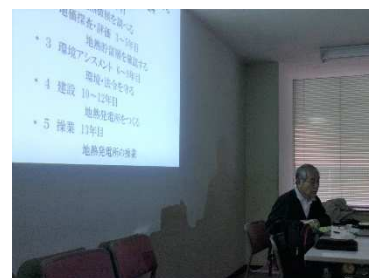
地熱発電について発表する会員