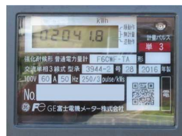
スマートメーター