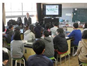
地球温暖化と省エネについて

「私達は何時間でも平気で電気をつけているけど、電気をおこすのは、とても大変でした。ふだん当たり前のように、電気を使い、テレビを見ています。エアコンもスイッチを止め忘れると”アー イッカ”とあまり反省せずに、スイッチを止めています。これからは、地球の私達の未来を考えて、なるべく電気を使わず、スイッチの止め忘れないようにします。」 [内田・桑原]