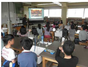
温暖化シミュレーションを見て 驚きの声を上げる児童たち

かくなるかも知れない。ふっとそんな気持ちが浮かんだ。今後こんな気持ちにはなりたくない。未来に向けて自分のやれる限りのことをしたいと思う。」