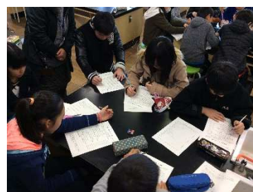
省エネチェックシートに記入する