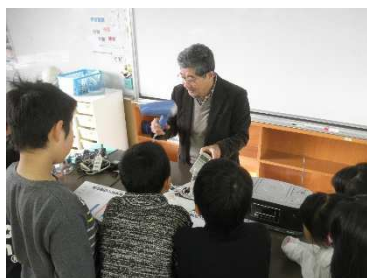
省エネ実験の説明を聞く児童たち

1月19日(木)、20日(金)の2日間にわたり、相模原市南区内の小学校で4年生5組158名を対象に学校出前授業を行いました。アース・エコは「さがみはら地球温暖化対策協議会(温対協)」の団体会員で、温対協と協働で相模原市内での様々な活動に取り組んでおり、今回も温対協や市役所の協力と東京ガス環境おうえん基金の助成金に基づいて実施しました。