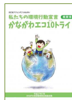
県のホームページより