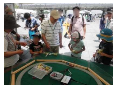
子どもたちには「電車の競走」を楽しんでもらいました。