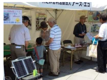
出展したアース・エコのブース

このイベントは、昨年まで「アジェンダの日」という名称でしたが今年からは「エコ10フェスタ」に変わりました。「エコ10」は、行動宣言の項目が10個あること及び地球環境保全に取り組むきっかけとして、一人ひとりが90の行動メニューから、まずは10個の行動メニューを選んで「マイエコ10宣言」をつくり、実践することを表しています。詳しくは↓をご覧ください。 [桑原]