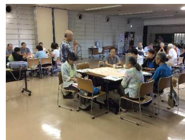
グループを代表して話し合いの結果を発表する参加者