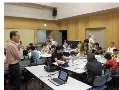
前半の地球温暖化の学習は低学年の子どもには少し難しかったか？

後半はスカイツリーの工作。特に小さい子どもは暑さのために集中力を維持するのが難しかったようですが、保護者の皆さんにも手伝ってもらって、全員時間内に完成させることができ、満足してもらえたと思います。 [桑原]