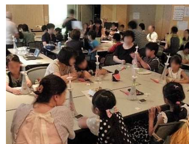
スカイツリーの工作も順調に進みLEDを点灯してみました