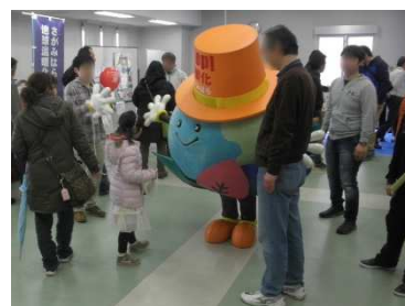
さがみはら地球温暖化対策協議会のマスコットキャラクター「さがぼーくん」と一緒に写真撮影

今回は桜美林大学の学生2人がボランティアとして参加し、協議会の出展を手伝ってくれました。昨年度、横浜の地区センターでの活動でアース・エコの出展を手伝ってくれた学生と、インターンシップでアース・エコの活動に参加した学生でした。 [桑原]