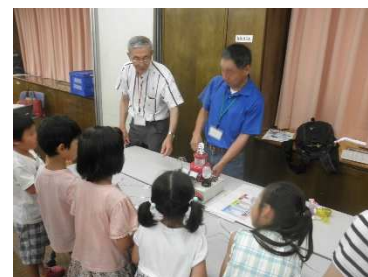
推進員横浜地区会議のメンバーも参加

後半はスカイツリーの工作。今回もスカイツリーに取り付けたLEDが点灯しないセットが出て、終了時間が15分程延びてしまいましたが、参加者全員がスカイツリーを完成させることができました。 [桑原]