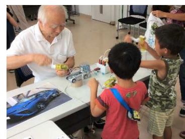
手回し発電機を回して水素を作り 模型の燃料電池自動車に充填

模型の燃料電池自動車を走らせるのには水素が必要ですが、子どもたちに手回し発電機を回してもらい、作った電気で水を電気分解して水素を