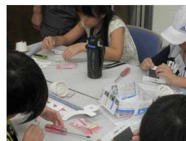
スカイツリーの工作に取り組む