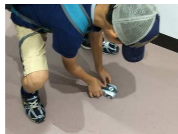
模型の燃料電池自動車を走らせる