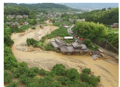
福岡県朝倉市の被害の様子