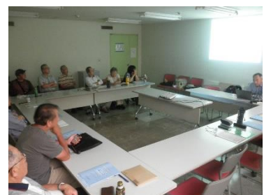
家電リサイクル法の施行状況の報告を聞く