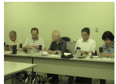
参加者全員で工作にチャレンジ