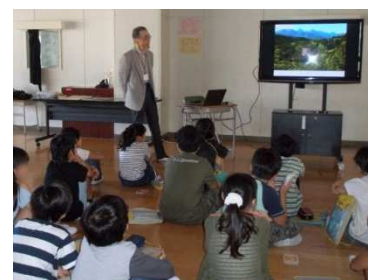
地球温暖化について学ぶ

10日程前に子どもたちは八ヶ岳山麓でのキャンプを体験してきたとのことで、自然の大切さ、自然保護の難しさから話を始め、環境問題である地球温暖化について説明し、学んでもらいました。省エネ実験では、手回し発電機による発電、照明消費電力測定、待機電力/ドライバー消費電力