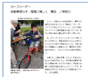
毎日新聞に掲載された記事