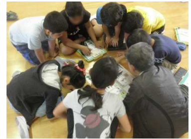
ゲーム「暮らし方の違いさがし」

快適さを追求するだけでなく、環境を守ることも大切であることに気がついたようです。家族での省エネの取り組みに期待します。 [桑原]