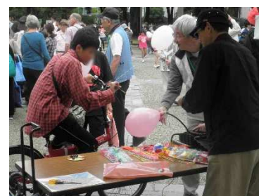
人力発電自転車で風船を膨らませる

翌日の毎日新聞朝刊神奈川版にはカーフリーデーの記事が掲載され、アース・エコの出展の様子を写した写真が紹介されました。 [桑原]