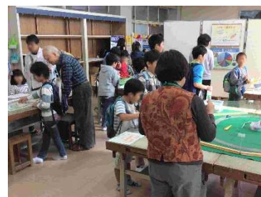
出展したアース・エコのブース

開催時間は午前 10 時から午後 2 時までと短時間でしたが、子ども約 120 名と保護者約 50 名がアース・エコのブースに来場しました。中には 2 度 3 度とブースに来て電車の競走を楽しんでいく子どももいました。[桑原]