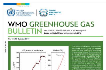
WMO 温室効果ガス年報

世界気象機関(WMO)は 2016 年の人間活動による CO 2 放出について「増加は鈍化・頭打ちだが放出量は過去最高」と発表しました。「大気中温室効果ガスの急速な濃度上昇は気候システムに予測不可能な変動をもたらす生態系や経済に深刻な混乱が生じる恐れがある」と警告しています。