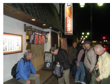
参加したメンバーと「とりおか」

地図： https://tabelog.com/kanagawa/A1408/A140801/14027167/