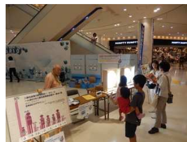
クールシェアイベント