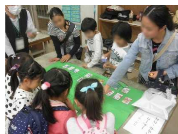
エコかるた取りを競う子どもたち