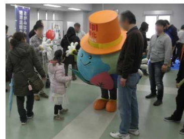
かんきょうフェア 2017