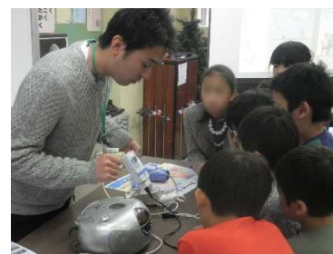
省エネ実験で待機電力の説明をする インターンシップの大学生