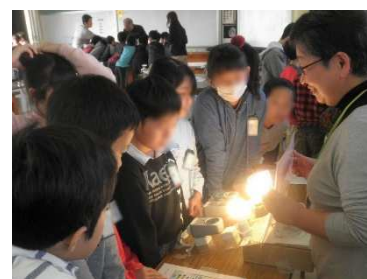
最近加入した会員も 省エネ実験の説明にチャレンジ