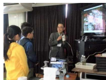
テレビの画面輝度と消費電力の実験