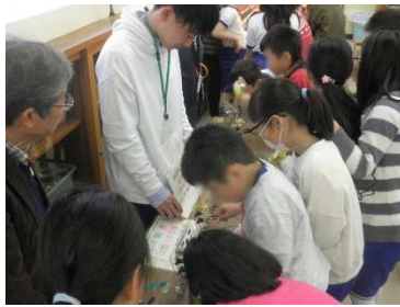
電気の実験の指導をする Y さん