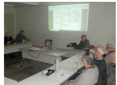
環境影響評価についての発表を聞く

環境影響評価(環境アセスメント)について発表がありました。法令や規則の体系、神奈川県条例、目的、対象となる事業の紹介の後、実際にどのようなフローに従って評価が行われるか、火力発電所を新たに建設する場合を例にプロセスの説明がありました。フローは何段階ものステップで構成され、各段階で地域住民や関係省庁からの意見を聴取するなど、開始から完了までに数年をかけてプロセスが実行されるとの説明でした。 [桑原]