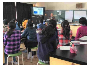
地球温暖化について話す筆者

今回、葉山の私たちと同年代の方2名が見学に参加し、私たちの活動内容の大切さを感じて頂けたようで、私たちと一緒に活動に加わって頂ける事も期待できそうです。 [内田]