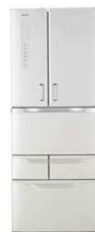
現在使用している冷蔵庫 (以前使用していたモデルの写真は見つかりませんでした。)