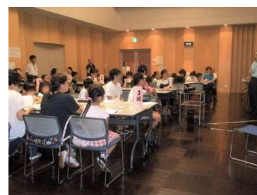
公共施設からの依頼で工作教室