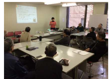
外部から講師を招いて勉強会