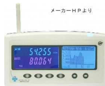
今回の測定に使用した省エネナビ (中国計器工業製)

冷蔵庫に電力計を取り付け、2018年2月の28日間、消費電力を測定しました。測定には相模原市環境政策課から省エネナビを借用し、取り付け方を工夫して冷蔵庫単体の消費電力を測定できるようにしました。2010年2月に前の冷蔵庫を同様に測定したデータと比較したのが右下の図です。