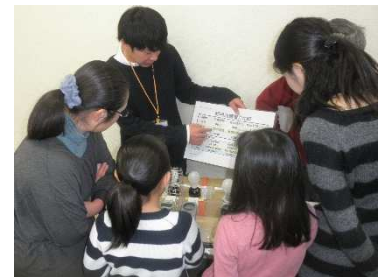
ボランティア活動を体験する インターンシップ学生