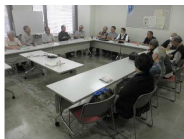
合同勉強会で歓談する出席者

学校出前授業など、日程が決まった12件の活動について実施内容の確認、参加者の調整などを行いました。