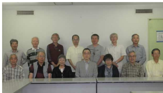
総会に出席した会員の皆さん

予定の議案の審議が終わり、午後5時に散会しました。その後会場を変えて開催した懇親会には13名が参加しました。