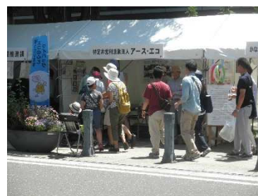
アース・エコが出展したテントブース