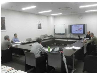
受講生の皆さんにお話しする筆者

ユニコムプラザさがみはら(相模原市立市民・大学交流センター)は事業のひとつとして「さがみはら地域づくり大学」を開校しています。12月22日(土)、昨年度に続き応用コース「環境～地域の自然と私たちの生活から考える～」のひとつの講師を担当し、「気候変動(地球温暖化)と私たちの暮らし」と題して家庭でできる地球温暖化防止について45分間お話ししました。