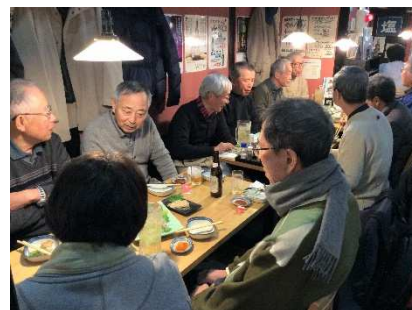
忘年会を兼ねた懇親会を開催