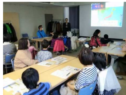
温暖化について学習する参加者

この教室もよこはま夢ファンドの助成金によって開催しましたが、今年度の助成金の対象事業はこれで完了です。よこはま夢ファンドにご寄付いただいた皆様にも厚く御礼申し上げます。 [桑原]