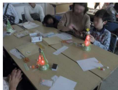
部屋の明かりを暗くして点灯式