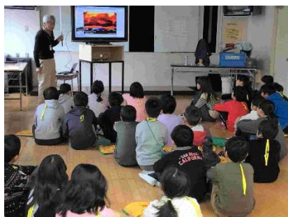
地球温暖化の説明を聞く児童

12 月 10 日(月) 横浜市緑区内の小学校で 5 年生 3 クラス 94 名を対象にかながわ環境教室「あなたも省エネに挑戦！地球温暖化防止」をテーマに出前授業を実施しました。講師・スタッフとして参加したのは 6 名です。