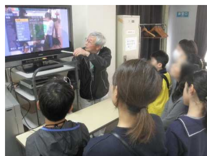
テレビの省エネ実験を見る