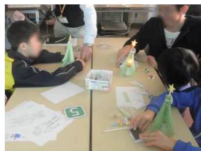
組み立てたクリスマスツリーを点灯