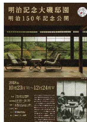
明治記念大磯邸園公開のポスター

今回が平成30年の最後の合同勉強会のため、終了後、会員など13名の有志により会場近くの居酒屋で忘年会を兼ねた懇親会を開催しました。