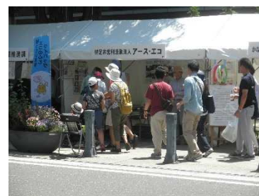
エコ 10 フェスタ 2017 出展の様子

アース・エコは 26 日(土)のみ出展します。横浜公園の市庁舎前の入口近くの 10 番ブースで皆さんのご来場をお待ちしています。